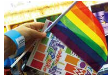
名古屋レインボープライドで一緒に歩きました（2019年）

相談できない現状があり、社会生活を送るうえで様々な困難が伴っている」（市民協働部長）、「人権擁護と相談支援の観点から、連携して重層的な支援に取り組んでいく」（企画政策部長）、「啓発を広く、全庁的に取り組みたい」（市長）との答弁が得られました。